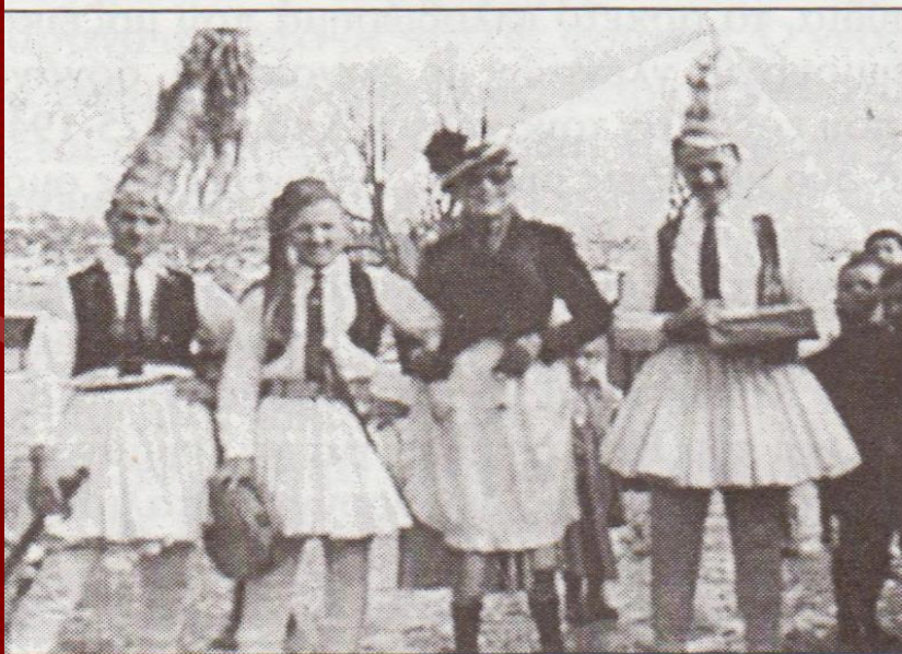
Ομάδα «σκούφων» σε σοκάκι του χωριού το 1959.