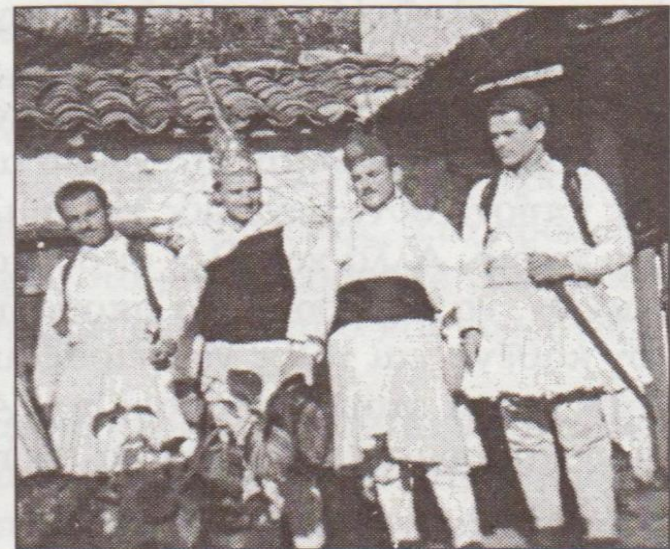
Ομάδα «σκούφων» σε αυλή του σπιτιού στο τραγούδημα των οικολογικών τραγουδιών το 1951.